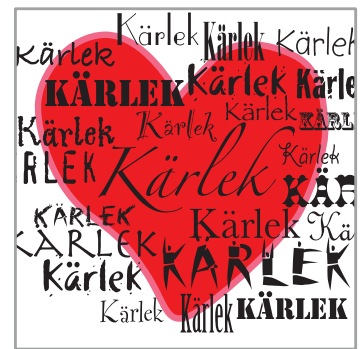
228 KÄRLEK • "Love"

KÄRLEK Ett mjukt och kompromisslöst hjärta fullt med kärlek i alla former.