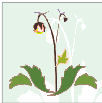
139 Humleblomster • Water Avens Geum rivale

Med de sju blommornas namn på svenska o latin på baksidan.