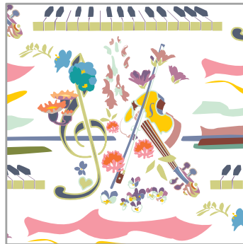
141 Frösöblomster • Frösö Flowers

Färgsättningen och motiven i mönstret är inspirerade av Wilhelm Peterson-Berger som inte bara brydde sig om musik utan också var djupt engagerad i form och färg. Hans Sommarhagen är ritat ända in i minsta detalj med viljan att återspegla och harmonisera med den omgivande naturen, huset är genomgående målat med antroposof-färger bl annat i kulörer hämtade från utsikten över Storsjön och fjällvärlden i kvälls-sol.