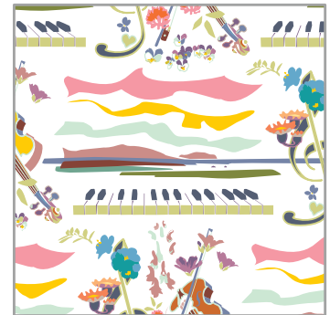
140 Utsikt från Sommarhagen • View From Sommarhagen

Med de sju blommornas namn på svenska o latin på baksidan.